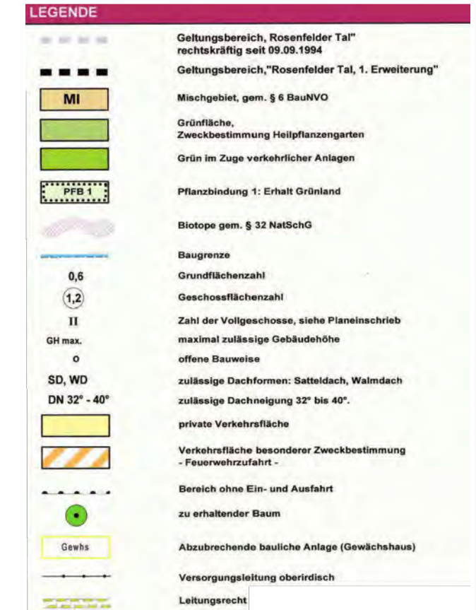
Lage im Raum

Nachrichtlich Legende BBP "Rosenfelder Tal, 1. Erweiterung"